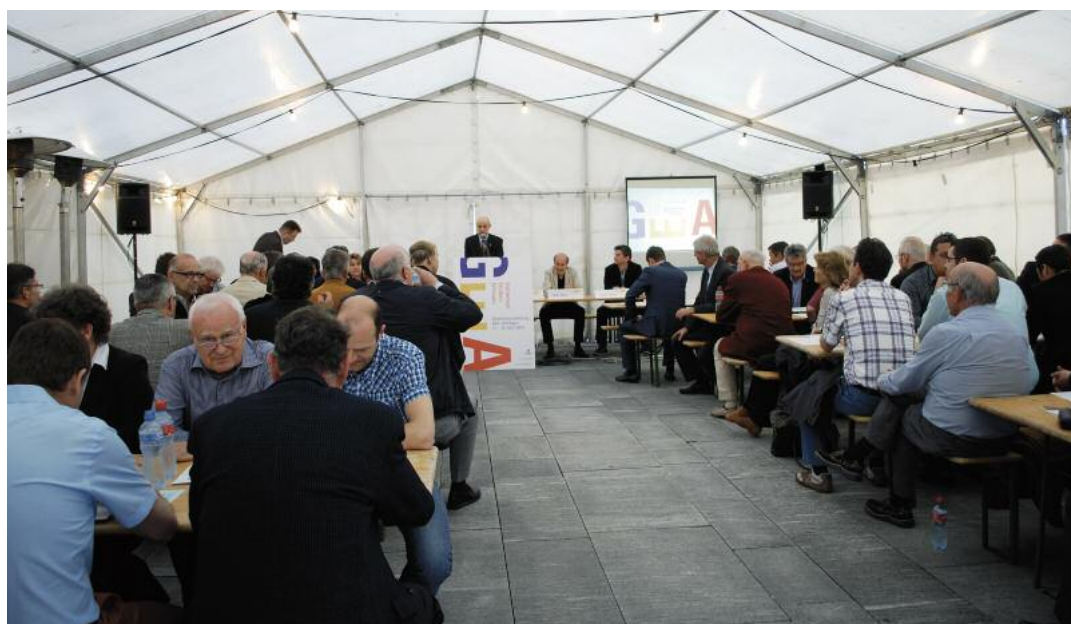
Die originelle Kulisse für die Durchführung der Hauptversammlung: Das Festzelt auf dem Marktplatz Muri.

Fyrabebier am 13. Juni und 12. September Herbstausflug am 23. Oktober Gewerbler Apéro am 20. November GEA14 vom 11. bis 13. April 2014